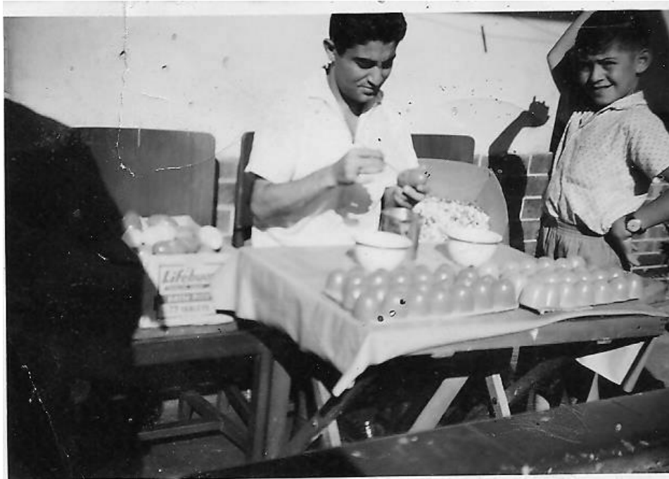
(Κατασκευαστής κέρινων αυγών τη δεκαετία του 1960)

«Χαρτοπονήματα τζιαι αφκοπονήματα», διαφήμιζε, θυμάμαι, ωςπραμάτεια του, τον χαρτοπόλεμο και τα κέρινα αυγά (που περιείχαν χαρτοπόλεμο-κομφετί), αντιστοίχως, ένας μικροπωλητής, στο καρναβάλι της Λεμεσού πριν πολλές δεκαετίες. Ο χαρτοπόλεμος παρέμεινε στοιχείο κάθε καρναβαλικής γιορτής. Τα κέρινα αυγά, όμως, εξαφανίστηκαν σταδιακά χωρίς να αποτελούν σήμερα μέρος αυτής της μεγάλης μαζικής, λαϊκής γιορτής της Λεμεσού. Αποτελούν μέρος της άυλης και υλικής πολιτιστικής κληρονομιάς των Λεμεσιανών, που είτε κατασκεύασαν είτε έριξαν κάποια κέρινα αυγά κάποτε. Τα κέρινα αυγά, έπεσαν θύματα κι αυτά της παγκοσμιοποίησης η οποία βρήκε πιο εύκολους τρόπους – μαζικούς κυρίως- ώστε να μην καταβάλλεται κόπος από τον συμμετέχοντα στο δρώμενο, π.χ. κατασκευή κέρινων αυγών για τα Καρναβάλια, αλλά χρήση βιομηχανοποιημένου σπρέϊ, που θα το βρει κάποιος σήμερα σε οποιοδήποτε